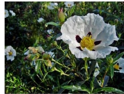
Cistus ladanifer Jara pringosa